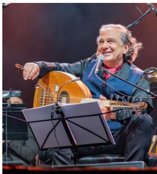
Tocador de Oud Rabih Abou-Khalil